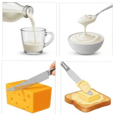
Imágenes generadas con ChatGPT

Clase IV– Mantequilla que se puede esparcir .